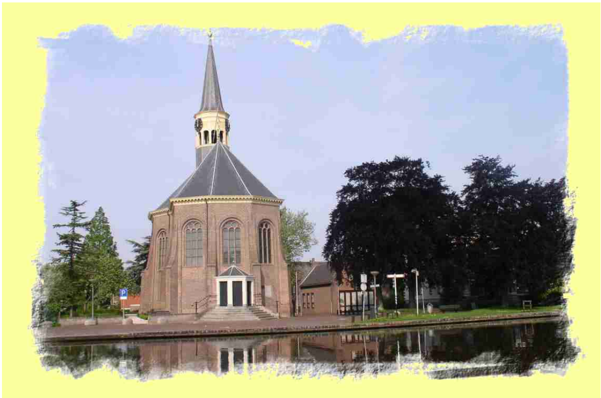
Hervormde Kerk Woubrugge