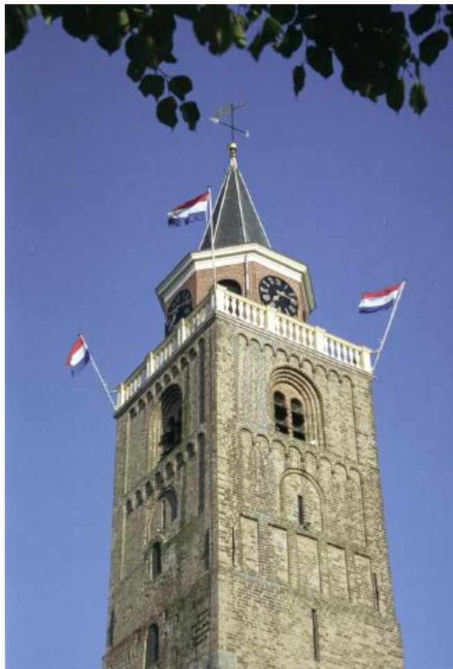
Toren van de Hervormde Laurentiuskerk te Rijnsburg